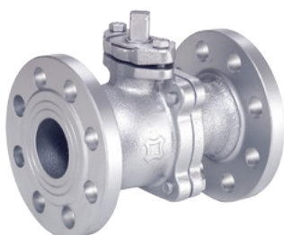
FIG.FK16D JIS 20K