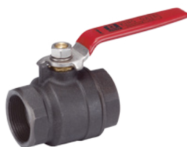
FIG.16D JIS 10K/KGMC 16K