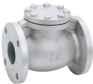
FIG.FK69D-BC JIS 20K