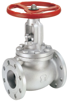
FIG.FK39D-BB JIS 20K