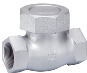
FIG.U69D JIS 20K