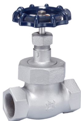
FIG.U39D JIS 20K