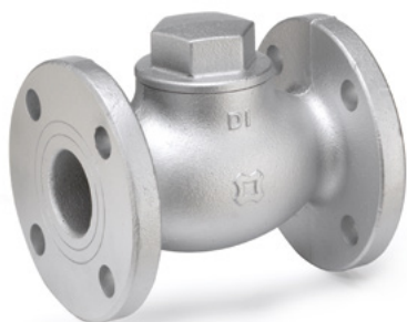
FIG.F67D JIS 10K