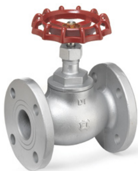
FIG.F37D JIS 10K