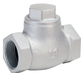
FIG.69D-G JIS 10K/KGMC 16K